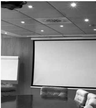
Imagen de las instalaciones

Esta División se fundó a raíz de los acuerdos de distribución alcanzados con los fabricantes Anders + Kern y Davis a nivel nacional. Anders + Kern -empresa alemana- fabricante de retro-