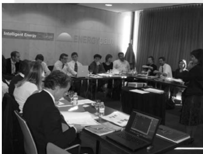
Instantánea del momento de la presentación

El proyecto está dirigido a profesores y agentes relacionados con la educación y la energía; y estudiantes de secundaria de 16 años principalmente y público en general.