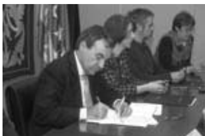
Instantánea del momento

El Ejecutivo regional destinará este año 11,3 millones de euros para dotar de mayores y mejores recursos humanos, materiales y de formación del profesorado a los 82