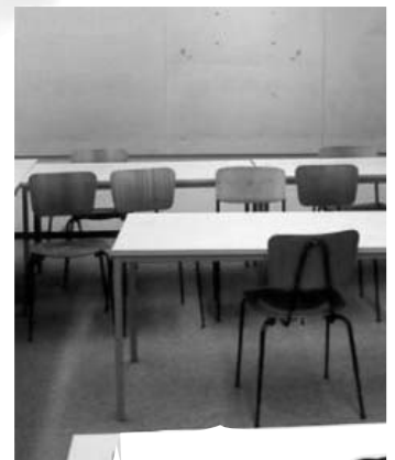
imagen de aula

En ese caso concreto, ¿qué pasará con la vocación del profesor? ¿Tendrá sentido seguir luchando por lo que él cree correcto? ¿Se está dando un mensaje al alumno y a la sociedad? ¿Es el mobbing sólo un término aplicado al mundo de la empresa? ¿Falta respaldo a la firmeza?... La contestación a estos interrogantes deja de tener importancia.